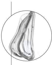
Мембрана прокладки маски – вид сбоку

сохраняется герметичность и возможность открывать рот и двигать челюстью